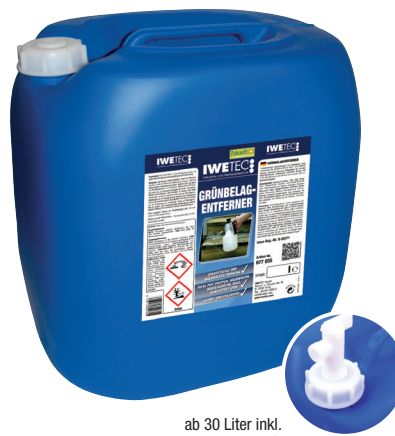
ab 30 Liter inkl. Kombi-Auslaufhahn

i Grünbelagentferner sicher verwenden. Vor Gebrauch stets Kennzeichnung und Produktinformationen lesen.